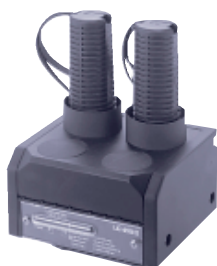
Зарядное устройство LG 493